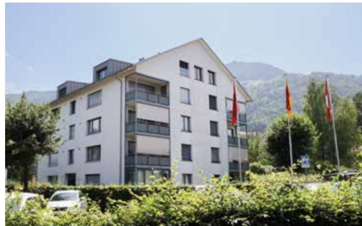
Marianne Sauter-Winteler, Bewohnerin Alterswohnung

«Ich fühle mich sehr wohl in meiner Alterswohnung. Langweilig ist mir nie, und ich genieße meine Unabhängigkeit. Trotzdem bin ich froh um das Sicherheitsnetz des Alterszentrums.»